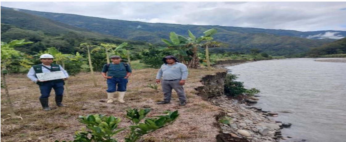
FOTO N° 02. TRAMO CRITICO EN LA MARGEN DERECHA DEL RIO YANATILE, EN EL SECTOR REMOLINO, DISTRITO DE QUELLOUNO.