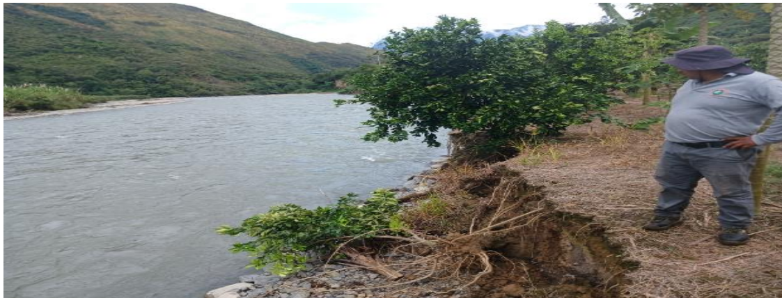
FOTO N° 03. TRAMO CRITICO EN LA MARGEN DERECHA DEL RIO YANATILE, EN EL SECTOR REMOLINO, DISTRITO DE QUELLOUNO.

Ministerio de Desarrollo Agrario y Riego