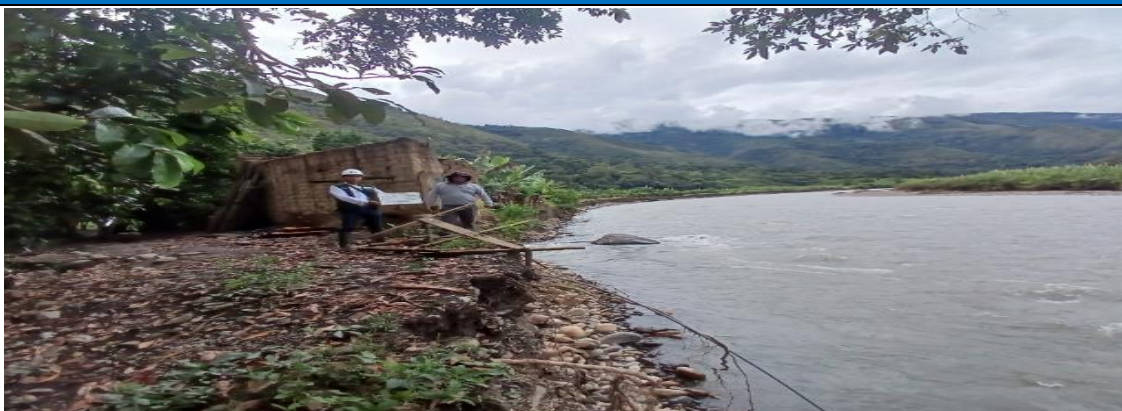
FOTO N° 01. TRAMO CRITICO EN LA MARGEN DERECHA DEL RIO YANATILE, EN EL SECTOR REMOLINO, DISTRITO DE QUELLOUNO.